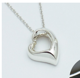
プレシャスハート