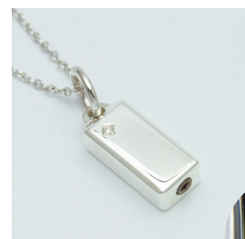
プレシャスモノリス