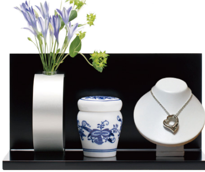
※ミニ骨壺などは商品に含まれません。