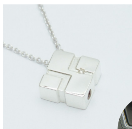
プレシャスクローバー