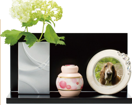
※ミニ骨壺などは商品に含まれません。